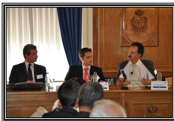
Fig.4. Mesa redonda “Sector Productivo”