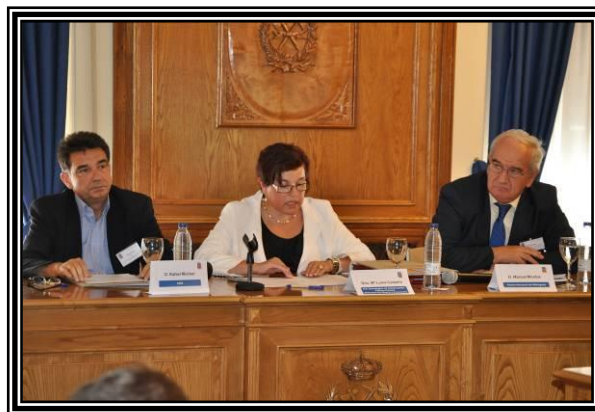
Fig. 6. Mesa redonda “colaboración público-privado”

Se considera imprescindible que el sector se coordine de cara a dar mensajes a la sociedad y a otros sectores. Por ejemplo en el caso del impulso del vehículo eléctrico, desde el sector se ha intentado transmitir el mensaje de que se tratan de tecnologías complementarias y en ningún caso opuestas. Para este tipo de mensajes se considera imprescindible la colaboración entre los diferentes actores implicados.