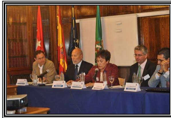
Fig.3. Mesa redonda “Ofertas-Demandas otros sectores”

activa. Se prevé una velocidad máxima de 25 kilómetros a la hora. A nivel internacional y europeo también existen varios proyectos en marcha.