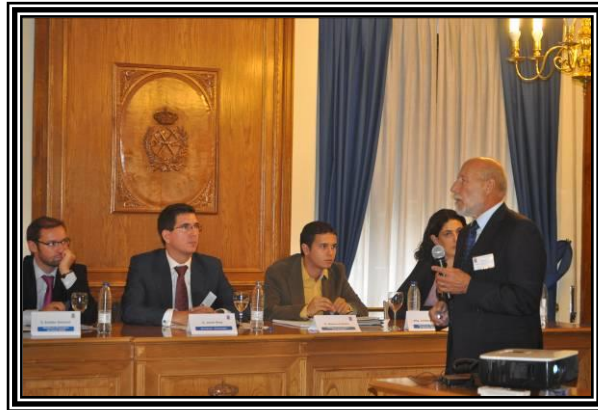
Fig.2. Mesa redonda “Ofertas-Demandas otros sectores”

nuevas membranas de intercambio de protones que promuevan el transporte selectivo y eficaz de protones y mejoren sus propiedades, introducción de nanopartículas, nuevas formulaciones poliméricas de alto rendimiento, líquidos iónicos y membranas de base enzimática); en el desarrollo de nuevos catalizadores más respetuosos con el medio ambiente; y en el desarrollo de pilas de combustible con bajo o sin contenido en metales nobles, lo que permitiría abaratar sus precios.